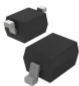
BA782S-E3-18 Electro-Films (EFI) / Vishay DIODE BAND SW 100MA SOD323