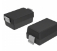
BA782-HG3-18 Vishay Semiconductor Diodes Division DIODE BAND SW 100MA SOD123