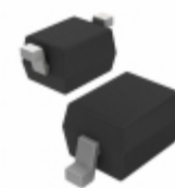
BA782S-E3-08 Electro-Films (EFI) / Vishay DIODE BAND SW 100MA SOD323